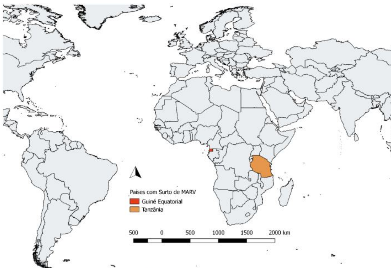
Figura 1. Países com surto ativo do vírus Marburg.

A Guiné Equatorial e a Tanzânia enfrentam, pela primeira vez, um surto de vírus Marburg (Figura 1). A Organização Mundial de Saúde (OMS) classifica o risco como muito alto em nível nacional, alto em nível sub-regional, moderado em nível regional e baixo em nível global. O Centro de Informações Estratégicas em Vigilância em Saúde (CIEVS) Nacional classifica o risco como moderado a nível nacional.