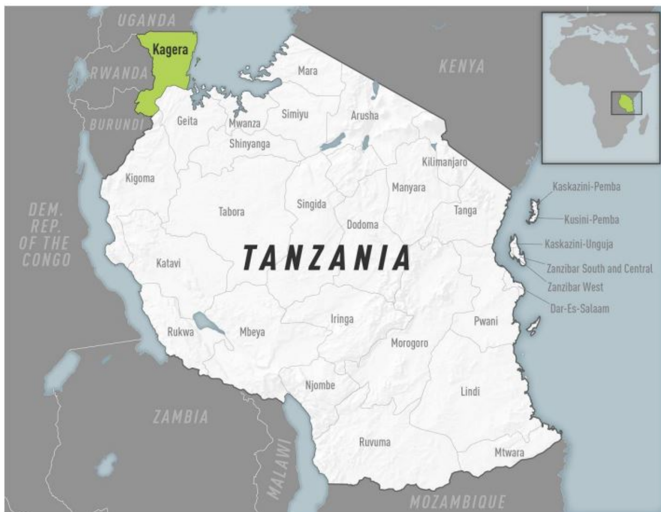
Figura 3. Regiões na Tanzânia com casos confirmados do vírus Marburg.